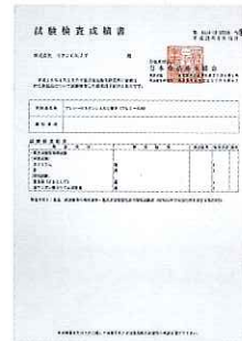
食品衛生法の規格基準に“適合”