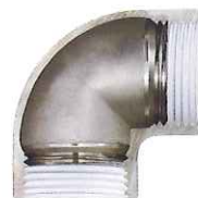
ZD SUS継手の断面(写真) ねじ奥にシール材を付けないことで端材の混入を防止、 接続部の緩み防止に効果あり

幅広い流体に使用可能な画期的なシール材を使用しております。シール材も人体には無害です。施工現場ではシール材の溶剤を必要としません。臭いもなく食品関係工場に最適です。また、蒸気配管への使用時に発生する膨張収縮にも耐え、漏れません。