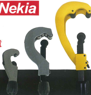
ガス用ポリエチレン管