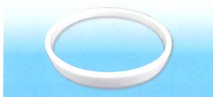
【スペーサー】主原料:ポパール (ポリビニルアルコール)