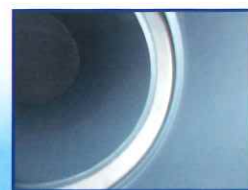
パイプ挿入時継手内部