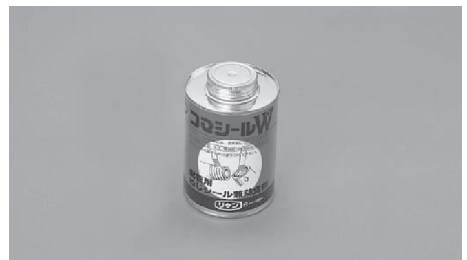
コマシール W (配管用ねじシール兼防食剤) ¥3,310