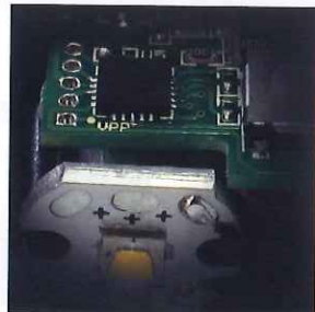
マイクロコントローラ搭載

建築・防災・警備等のプロ用ハイスpek LED ライトはマイコン搭載が世界標準となっているんです。