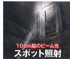
100m超のビーム光 スポット照射