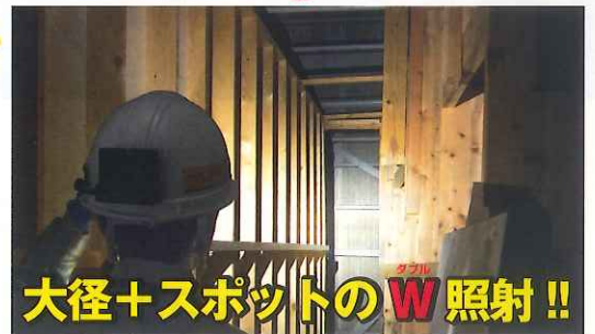
大径+スポットの W 照射!!