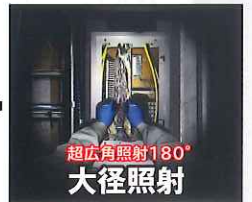
超広角照射180° 大径照射