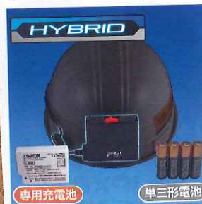
ハイブリッド外部電源 専用充電電池と単三型電池 4本の併用が可能

専用充電電池と単三電池4本のどちらも使える外部電源式充電電池は経済性が高く、万一充電切れしても単三電池で対応できるから安心です。