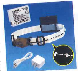
付属品もいろいろ!